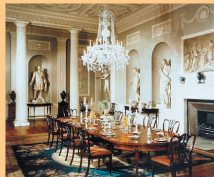
На фото: Lansdowne Club ( www.lansdowneclub.com )

Завершающий день. Гостям вновь будет предоставлен выбор: одно из мероприятий - это Европейский Симпозиум, главное место в которой займут выступления представителей разных стран европей-