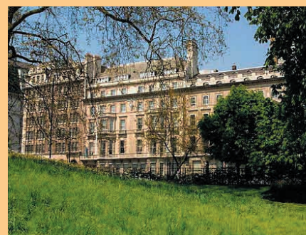
На фото: Royal Air Force Club ( www.rafclub.org.uk )

Для членов Альянса Частных Клубов стоимость участия в Конференции составляет 1030 Euro. Регистрационную форму можно получить, связавшись с представителями Альянса (см. контактную информацию).