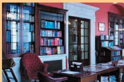
На фото: библиотека Royal Automobile Club ( www.royalautomobileclub.co.uk )

Открывающая Конференцию встреча, которая состоится 16 октября, представит делегатам возможность посетить Парламент. Также после коктейля хозяева вечера – сами члены Парламента! – проведут экскурсию по Палате лордов